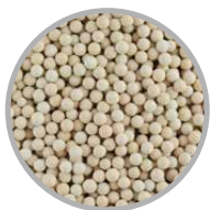
Combinazione di sfere di ceramica

blocchi di filtraggio a carbone attivo tradizionali, la velocità di scorrimento nei filtri MAUNAWAI® è notevolmente ridotta. Questo supporta l'elevata capacità di assorbimento del granulato utilizzato. Il filtro di carbonio attivo ad alto livello tecnologico realizzato da gusci di noce di cocco , elimina le sostanze nocive come cloro, pesticidi, metalli pesanti e molti altri contaminanti. Nel crocevia delle sostanze difficilmente assorbibili come il rame, lo zinco e antibiotici il sistema di filtraggio MAUNAWAI® si è rivelato favorevole.